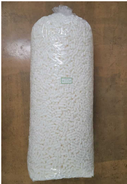
【バラ大袋】 容量 0.4 m 3